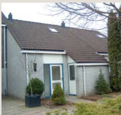
Molenrak 59, Emmeloord

In Emmeloord West gelegen geschakelde tussenwoning met inpandige berging en een grote tuingerichte woonkamer. De woning beschikt over twee ruime slaapkamers, badkamer met tweede toilet en een combiketel uit 1998.