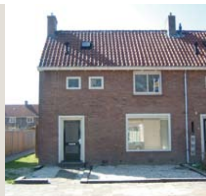
Lindenlaan 37, Emmeloord

Hoekwoning gelegen in een rustige woonomgeving nabij het centrum van Emmeloord met circa 330 m 2 grond. De woning met aangebouwde bijkeuken beschikt over o.a. een ruime L-vormige woonkamer met open keuken, drie slaapkamers, badkamer en een HR combiketel uit 2006.