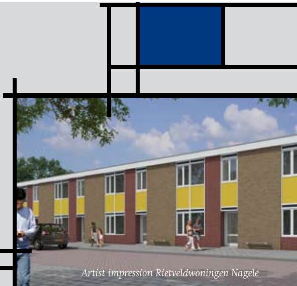
Artist impression Rietveldwoningen Nagele

meubels en later met de gebouwen die hij ontwierp.