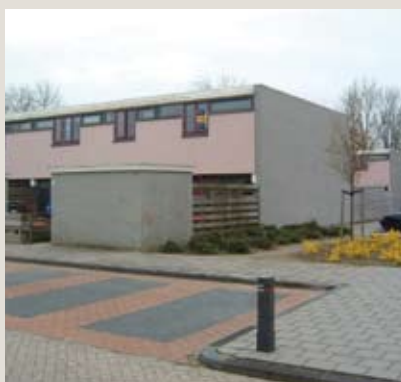
Saturnusstraat 64, Emmeloord

Eindwoning met een extra brede tuingerichte woonkamer en een achtertuin op het zuiden. De woning beschikt over o.a. drie slaapkamers met mogelijkheid tot een vierde, een badkamer met tweede toilet en is voorzien van een combiketel.