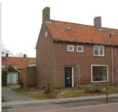
G.J. Gillotstraat 12, Ens

Gelegen in een rustige straat in het oudere gedeelte van Ens staat deze twee-onder-één-kapwoning met drie slaapkamers en een garage. Ens is een dorp in het zuidoosten van de Noordoostpolder met meer dan drieduizend inwoners. Door de N50 is de bereikbaarheid prima naar zowel Emmeloord als richting Zwolle.