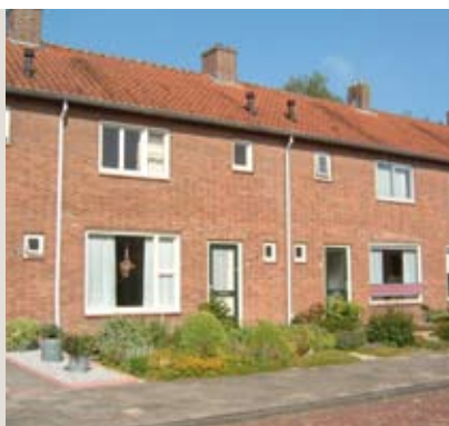
Abelenlaan 21, Emmeloord

Gelegen nabij het centrum, op loopafstand van scholen en andere voorzieningen staat deze tussenwoning in een rustige woonomgeving. Medio juni 2011 worden er nieuwe kozijnen geplaatst met HR++ glas.