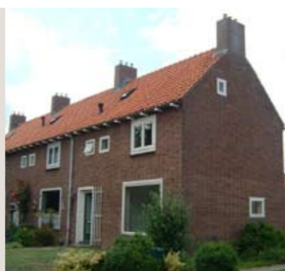
Bumalaan 13, Emmeloord

Nette hoekwoning met drie slaapkamers en vrijstaande berging gelegen in het centrum van Emmeloord. De woning staat op een perceel van circa 167 m 2 eigen grond en biedt de mogelijkheid voor een garage.