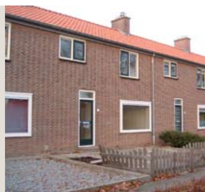
Leemansstraat 5, Emmeloord

Tussenwoning met drie slaapkamers en een vrijstaande berging. De woning is gelegen nabij het centrum met vrij uitzicht, speelveld en voldoende parkeergelegenheid in de directe omgeving.