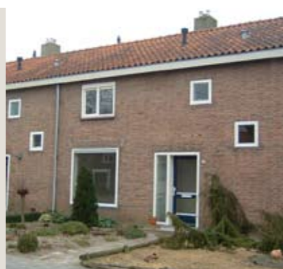
Bredenhof 8, Espel

Centraal in het groendorp Espel staat deze tussenwoning met drie slaapkamers. Aan de voorzijde van de woning ligt een brede groenstrook. Parkeren op eigen terrein is mogelijk aan de achterzijde.