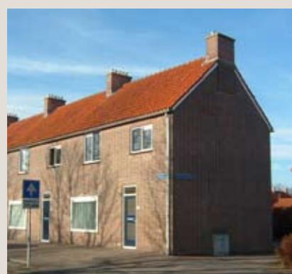
Tuinstraat 26, Luttelgeest

Hoekwoning met bijkeuken op een royaal perceel van circa 262 m 2 . Ruime woonkamer met schouw en open keuken. Drie slaapkamers op de 1e verdieping waarvan twee met vaste kastruimte.