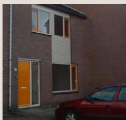
Enkhuizenstraat 10, Emmeloord

Tussenwoning gelegen in een geschakeld blok van acht woningen. De woning heeft een verrassende ruime woonkamer, een nette keuken en drie ruime slaapkamers op de verdieping. Gelegen in woonwijk De Zuidert op korte afstand van het centrum van Emmeloord.